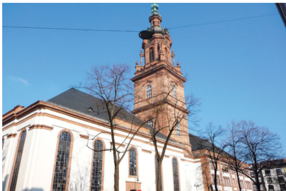
Die neue Konkordienkirche in Mannheim (links) wurde 1717 erbaut. Ihr Turm ist der höchste der Stadt. Kurfürst Karl Ludwig wacht heute über den Ratssaal im Heidelberger Rathaus.

Jahrhunderte lang tobte in der Kurpfalz ein blutiger Kampf der Konfessionen – Dann kam die Badische Kirchenunion – Sie feiert jetzt ihren 200. Geburtstag / Von Diana Deutsch