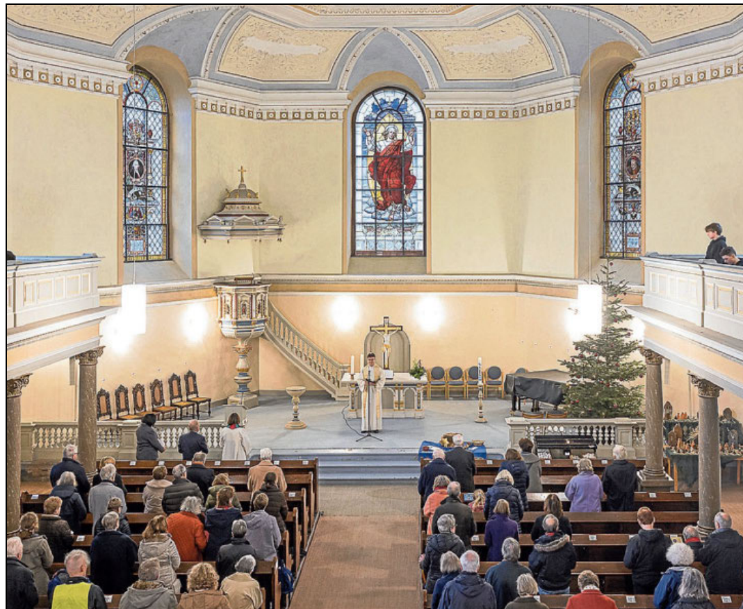
Mit einem Festgottesdienst „Fenster zum Himmel“ wurden die drei restaurierten Chorfenster in der Providenzkirche am Sonntag eingeweiht.